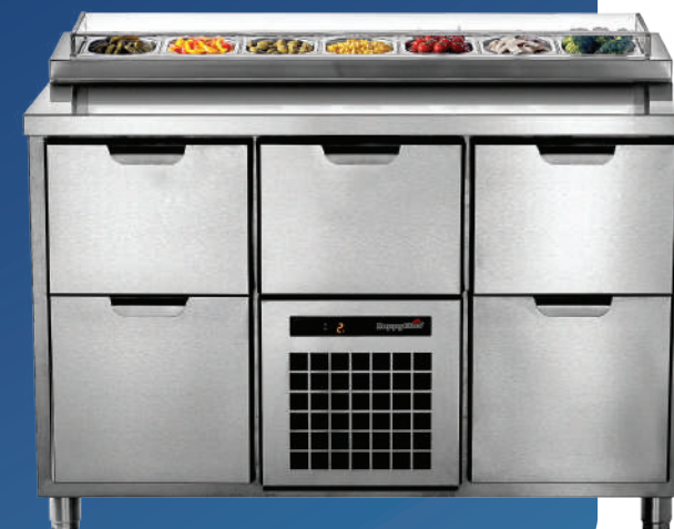
TC GS 2-CBR-2

Температурный режим +2...+12°C. В столешнице гастронормированный лоток для установки GN 1/3, GN 1/6, GN 1/9 с прозрачной крышкой. Съемный холодильный агрегат. Выдвижной ящик над агрегатом. Модульное строение.