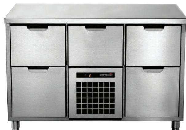
TC BD 2-CBR-2

Температурный режим +2...+12°C. Съемный холодильный агрегат. Выдвижной ящик над агрегатом. Модульное строение. Полностью из нержавеющей стали.