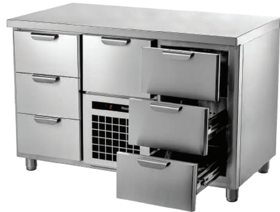
TC GH 3-CBR-3

Температурный режим +2...+12°C. Съемный холодильный агрегат. Выдвижной ящик над агрегатом. Модульное строение. Полностью из нержавеющей стали.