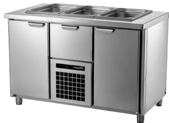
TC GA 1-CBR-1

Температурный режим +2...+12°C В столешнице гастронормированная ванна глубиной 210 мм с воздушным охлаждением. Холодильный модуль со съемной кассетой. Выдвижной ящик над агрегатом. Модульное строение. Полностью из нержавеющей стали.