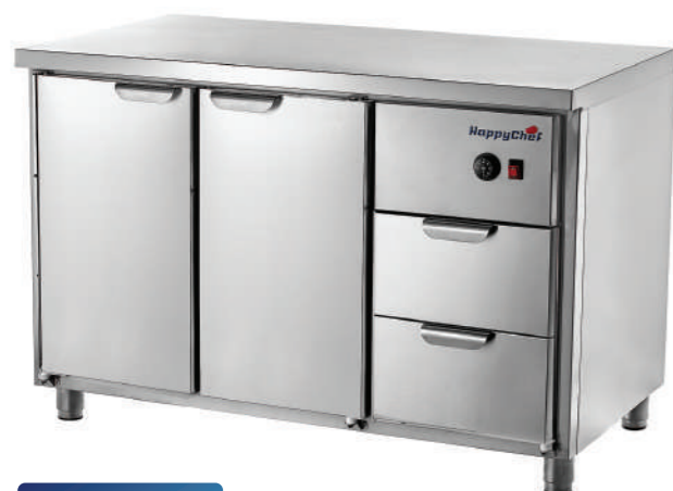
TH GN 1-1-P2

Температурный режим +30...+80 °С. Съемная тепловая кассета. Аналоговая панель управления. Полностью из нержавеющей стали.