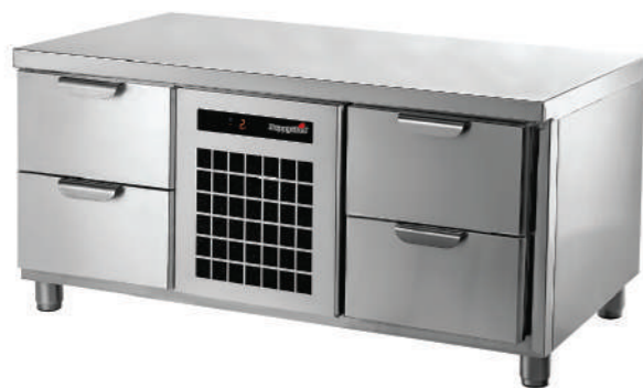
TC GL 2-CR-2

Температурный режим +2...+12°C. Высота корпуса 650 мм. Съемный холодильный агрегат. Модульное строение. Полностью из нержавеющей стали.