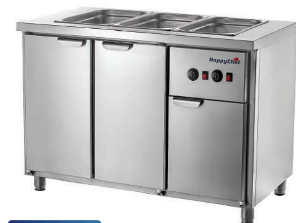
TH GM 1-1-P1

Температурный режим +30...+80 °С. В столешнице гастронормированная подогреваемая ванна Съемная тепловая кассета. Аналоговая панель управления. Полностью из нержавеющей стали.